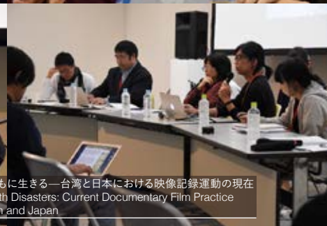
災害とともに生きる—台湾と日本における映像記録運動の現在 Living with Disasters: Current Documentary Film Practice In Taiwan and Japan