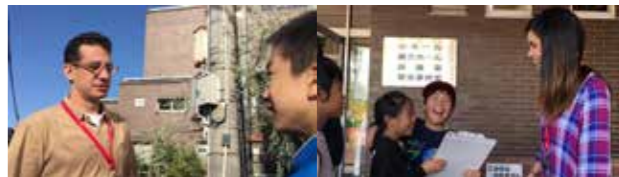
目指せ!バイリンガルレポーター! 世界の監督に突撃インタビュー! 10月13日[日] サポート:ジェイムズ英会話 YIDFF 2019 Kids Reports October 13 (Sun) Supported by James English School