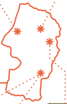
ジジ・ベラルディ監督 『山の医療団』 10月17日[木] 新庄北高校、 雪の里情報館(新庄市) Gigi Berardi (dir. Beyond the Salween River ) October 17 (Thu) Shinjo-Kita High School and City of Shinjo Snow Village Information Office (Shinjo City)