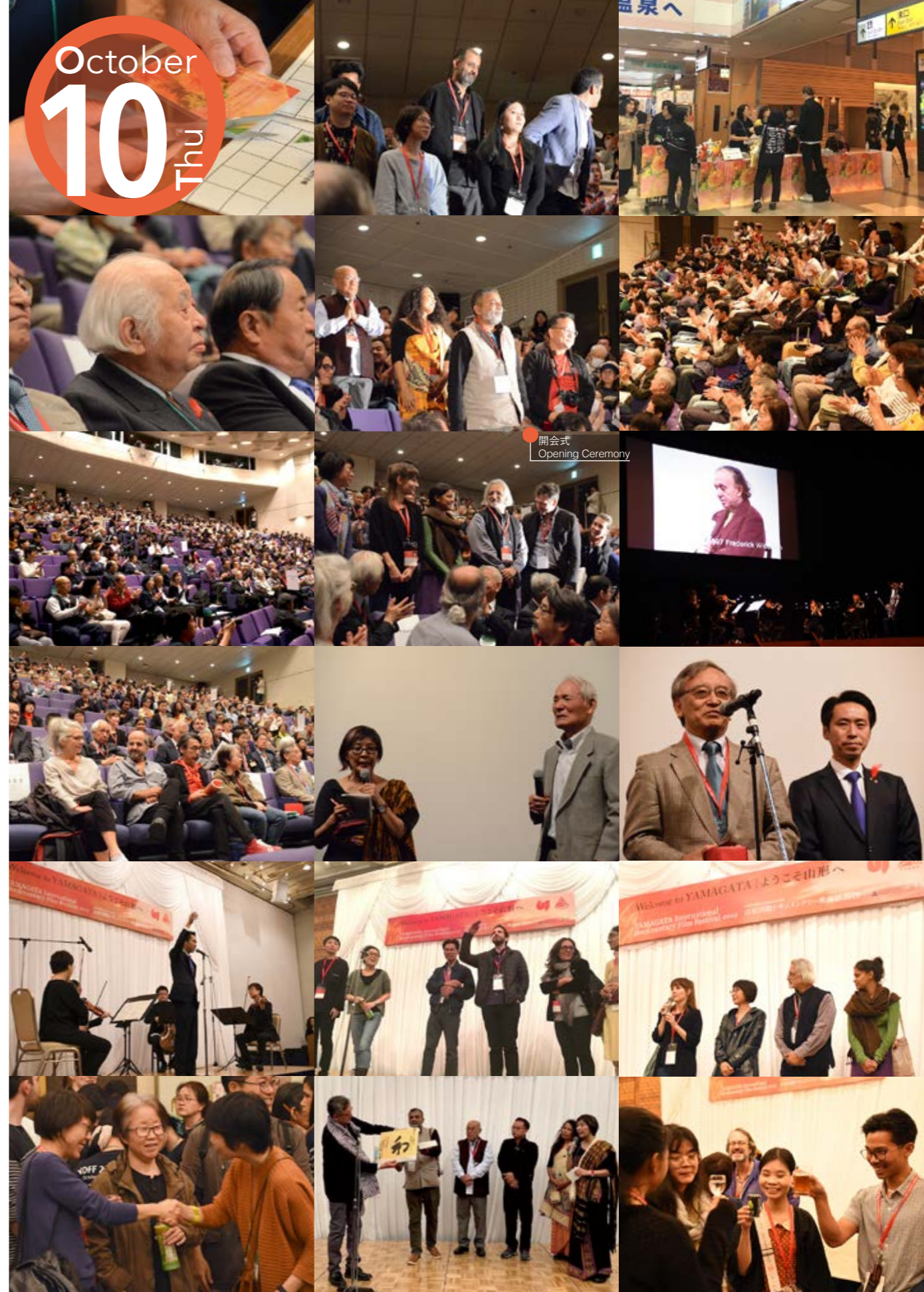
開会式 Opening Ceremony