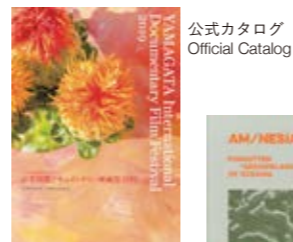
公式カタログ Official Catalog

Grant: The Japan Foundation Asia Center Grant Program for Promotion of Cultural Collaboration