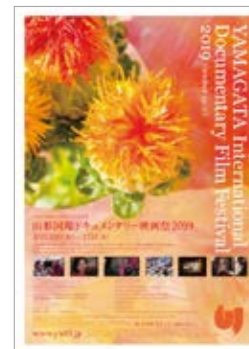
プログラムチラシ Program Flier