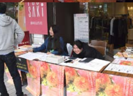
やまがたと映画館 Movie Theaters in Yamagata