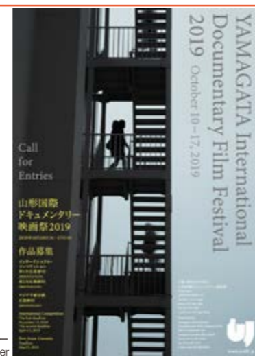
作品募集ポスター Call-for-entries Poster

応募総数 Total Entries 2,371 130の国と地域から from 130 countries and regions インターナショナル・コンペティション International Competition 1,428 123の国と地域から from 123 countries and regions アジア千波万波 New Asian Currents 943 68の国と地域から from 68 countries and regions