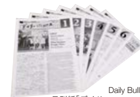
Daily Bulletin 日刊紙「デイリー・ニュース」