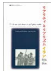
特集カタログ:リアリティとリアリズム Program Catalog: Reality and Realism