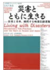
特集チラシ: ともにあるCinema with Us Program Flyer: Cinema with Us