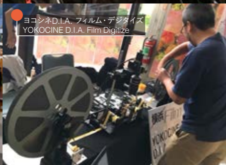
ヨコシネD.I.A. フィルム・デジタル YOKOCINE D.I.A. Film Digitize