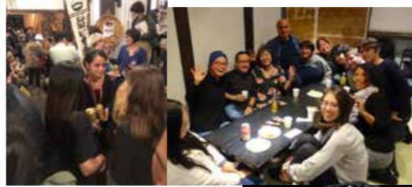
香味庵クラブ 10月11日[金]—16日[水] ※12日[土]は台風のため臨時休業 Komian Club October 11 (Fri)–16 (wed) *Closed on 12 (Sat) due to a typhoon