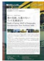
特集チラシ:春の気配、火薬の匂い Program Flyer: Rustle of Spring, Whiff of Gunpowder