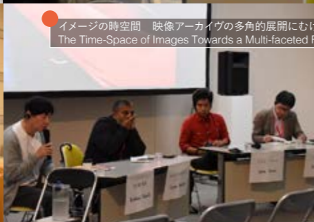
イメージの時空間 映像アーカイブの多角的展開にむけて2 The Time-Space of Images Towards a Multi-faceted Film Archive 2