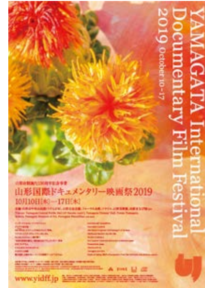
YIDFF 2019公式ポスター YIDFF 2019 Official Poster

With the Assistance of Motion Picture Producers Association of Japan, Japan Association of Audiovisual Producers, Inc., Japan Film Library Council/Kawakita Memorial Film Institute, Foreign Film Importers-Distributors Association of Japan, Directors Guild of Japan, Yamagata Prefecture, Yamagata Prefecture Board of Education, Yamagata City Board of Education, Yamagata Chamber of Commerce & Industry, Yamagata Prefectural Congress of Arts and Culture, Yamagata Arts and Culture Association, Tohoku University of Art & Design, Yamagata University, Yamagata Convention Bureau, Union Motion Pictures Exhibitors' Association of Yamagata Prefecture, Asahi Shimbun Publishing Co. Yamagata General Bureau, Kahoku Shinpo Publishing Co., Kyodo News Yamagata Branch, The Sankei Shimbun Yamagata Branch, Jiji Press Yamagata Branch, Nihon Keizai Shimbun Inc. Yamagata Branch, The Mainichi Newspapers Co., Ltd. Yamagata Branch, The Yomiuri Shimbun Yamagata Bureau, The Yamagata Shimbun Newspaper/Yamagata Broadcasting Co., Ltd., NHK (Japan Broadcasting Corporation) Yamagata, Sakuranbo Television Broadcasting Co., TV-U Yamagata, Inc., Yamagata Television System, Inc., Broadcasting of FM Yamagata, Yamagata Community Broadcasting Co.