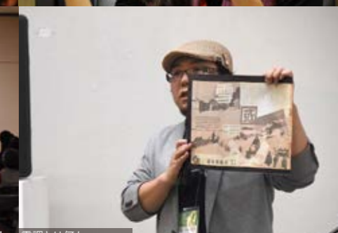
雪国を、生きる！～雪調とは何か～ Living in Snow Country! What is Seccho?