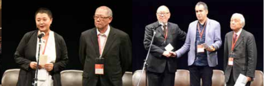
表彰式 Awards Ceremony