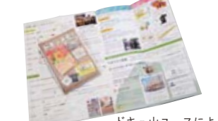
ドキュ山コースによる 情報紙「ドキュメモ！」 Documemo by Docuyama Youth