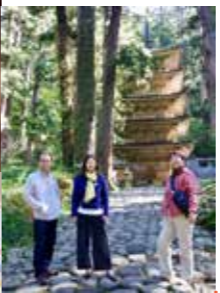
章夢奇(ジャン・モンチー)監督 『自画像:47KMの窓』 10月17日[木] 鶴岡まちなかキネマ(鶴岡市) Zhang Mengqi (dir. Self-Portrait: Window in 47 KM ) October 17 (Thu) Tsuruoka Machinaka Kinema (Tsuruoka City)