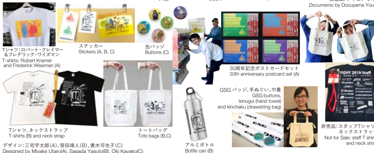
Ｔシャツ:ロバート・クレイマー &フレデリック・ワイズマン T-shirts: Robert Kramer and Frederick Wiseman (A)