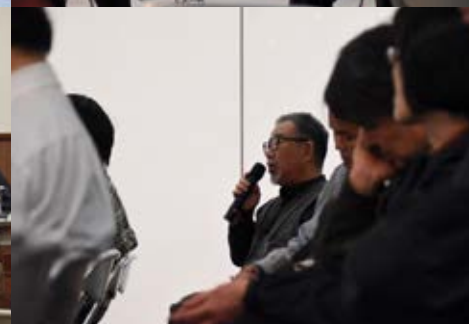
YIDFF30年：これまで、そして、これから YIDFF Thirty Years: Our Past and Our Future