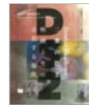
特集カタログ:二重の影2 Program Catalog: Double Shadows 2